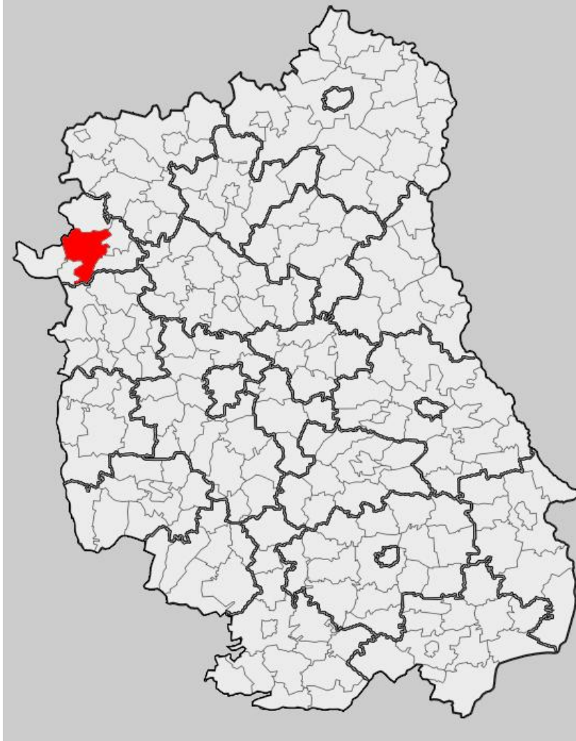
Mapka: woj. lubelskie